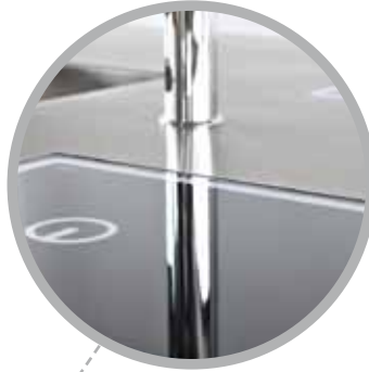
► Flächenbündiger Einbau von thermischen Geräten