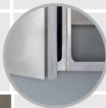
► Individuelle Unterbauten fugendicht verbaut