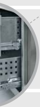
► Wärmeschubladen mit Vollauszug

Mit einer zusätzlichen elektrohydraulischen Höhenverstellung ausgestattete Spezialherde ermöglichen per Tastendruck eine ergonomisch optimale Arbeitshöhe.