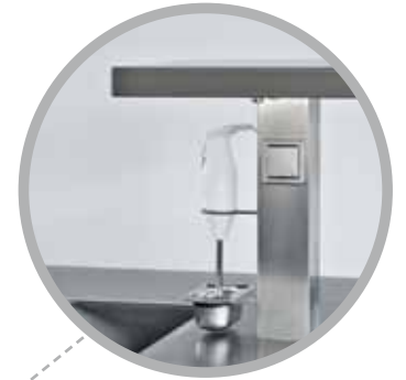
► Aufsatzbord mit Zauberstabhalterung und Tropfschale