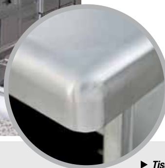
► Tischplatte mit Kugelecken und Tropfkante