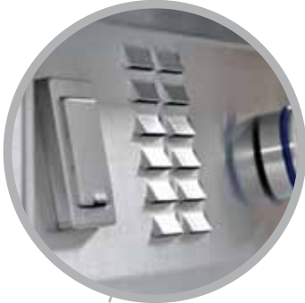
► Bedienschalterblende mit Lüftungsklappen