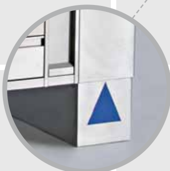
► Höhenverstellung mit 280 mm